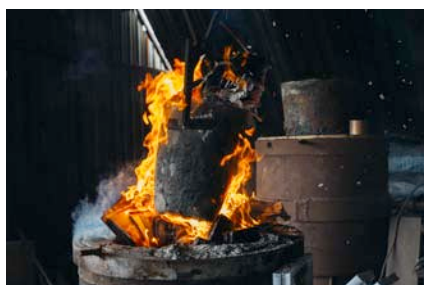
Стефан Николаев Автофикция (процес), 2015 архивен мастиленоструен печат на баритна хартия, монтирано на еталбонд, рамкиранна фотография: Калин Серапионов 47 x 35 см 8+4AP

Stefan Nikolaev Autofiction (process), 2015 archival inkjet print on baryta paper, etalbond mounted, framed photo: Kalin Serapionov 47 x 35 cm 8+4AP