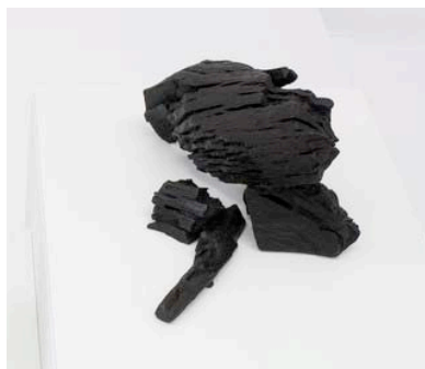
Стефан Николаев Здравей, Тъмнина, I, 2015 бронз скулптура 38 x 31 x 15 см 3+2AP