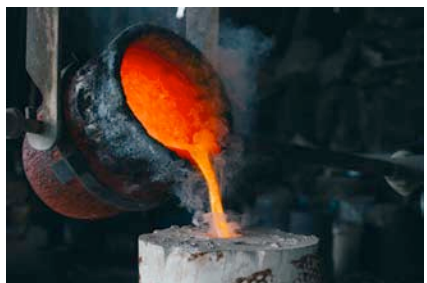
Стефан Николаев Автофикция (процес), 2015 архивен мастиленоструен печат на баритна хартия, монтирано на еталбонд, рамкиранна фотография: Калин Серапионов 47 x 35 см 8+4AP

Stefan Nikolaev Autofiction (process), 2015 archival inkjet print on baryta paper, etalbond mounted, framed photo: Kalin Serapionov 47 x 35 cm 8+4AP