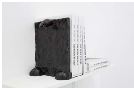
Стефан Николаев Автофикция, 2015 бронз скулптура, книги 30 x 20 x 24 см 8+4AP

Stefan Nikolaev Autofiction, 2015 bronze sculpture, books 30 x 20 x 24 cm 8+4AP