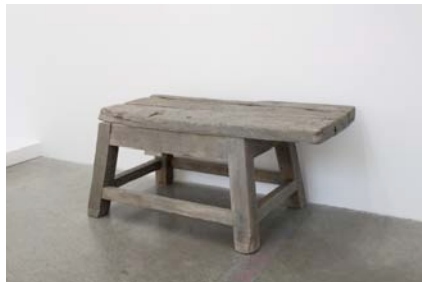
Стефан Николаев Бизнес, модел, скулптура, 2015 бронз скулптура 105 x 55 x 47 см 5+2AP