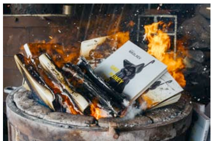
Стефан Николаев Автофикция (процес), 2015 архивен мастиленоструен печат на баритна хартия, монтирано на еталбонд, рамкиранна фотография: Калин Серапионов 47 x 35 см 8+4AP

Stefan Nikolaev Autofiction (process), 2015 archival inkjet print on baryta paper, etalbond mounted, framed photo: Kalin Serapionov 47 x 35 cm 8+4AP