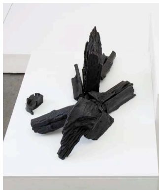
Стефан Николаев Здравей, Тъмнина, II, 2015 скулптура, бронз 46 x 38 x 20 см 3+2AP