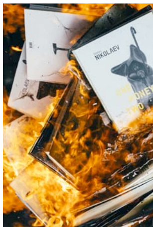
Стефан Николаев Автофикция (процес), 2015 архивен мастиленоструен печат на баритна хартия, монтирано на еталбонд, рамкиранна 64 x 46 см 8+4AP

Stefan Nikolaev Autofiction (process), 2015 archival inkjet print on baryta paper, etalbond mounted, framed 64 x 46 cm 8+4AP