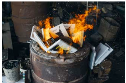
Стефан Николаев Автофикция (процес), 2015 архивен мастиленоструен печат на баритна хартия, монтирано на еталбонд, рамкиранна фотография: Калин Серапионов 47 x 35 см 8+4AP

Stefan Nikolaev Autofiction, 2015 bronze sculpture, books 30 x 20 x 24 cm 8+4AP