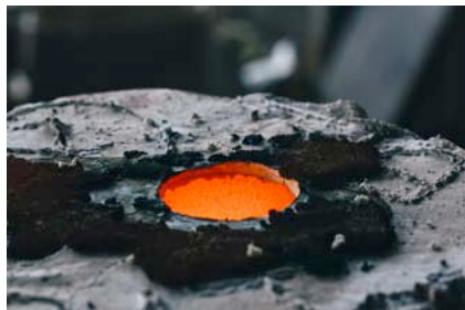
Стефан Николаев Автофикция (процес), 2015 архивен мастиленоструен печат на баритна хартия, монтирано на еталбонд, рамкиранна фотография: Калин Серапионов 47 x 35 см 8+4AP

Stefan Nikolaev Autofiction (process), 2015 archival inkjet print on baryta paper, etalbond mounted, framed photo: Kalin Serapionov 47 x 35 cm 8+4AP